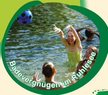
Badevergnügen im Runfensee