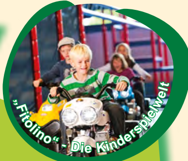
„Fitolino“ - Die Kinderspielwelt