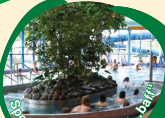
Sport- und Freizeitbad „baffi“