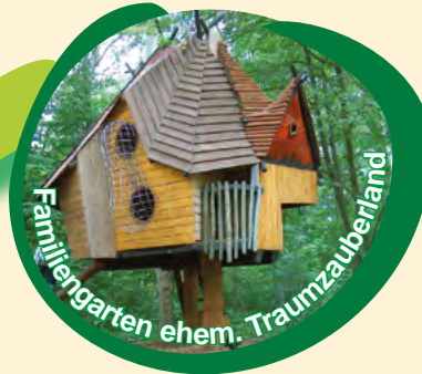
Familiengarten ehem. Traumzauberland